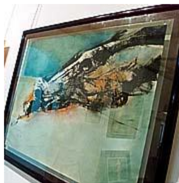
Obra Caballo de Fernando Carballo.

Horario: Lunes a domingo 9:00 a. m.- 7:00 p. m.